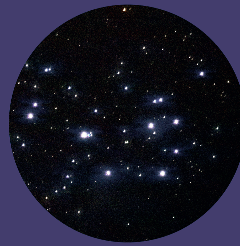
... und durch das Fernglas betrachtet.